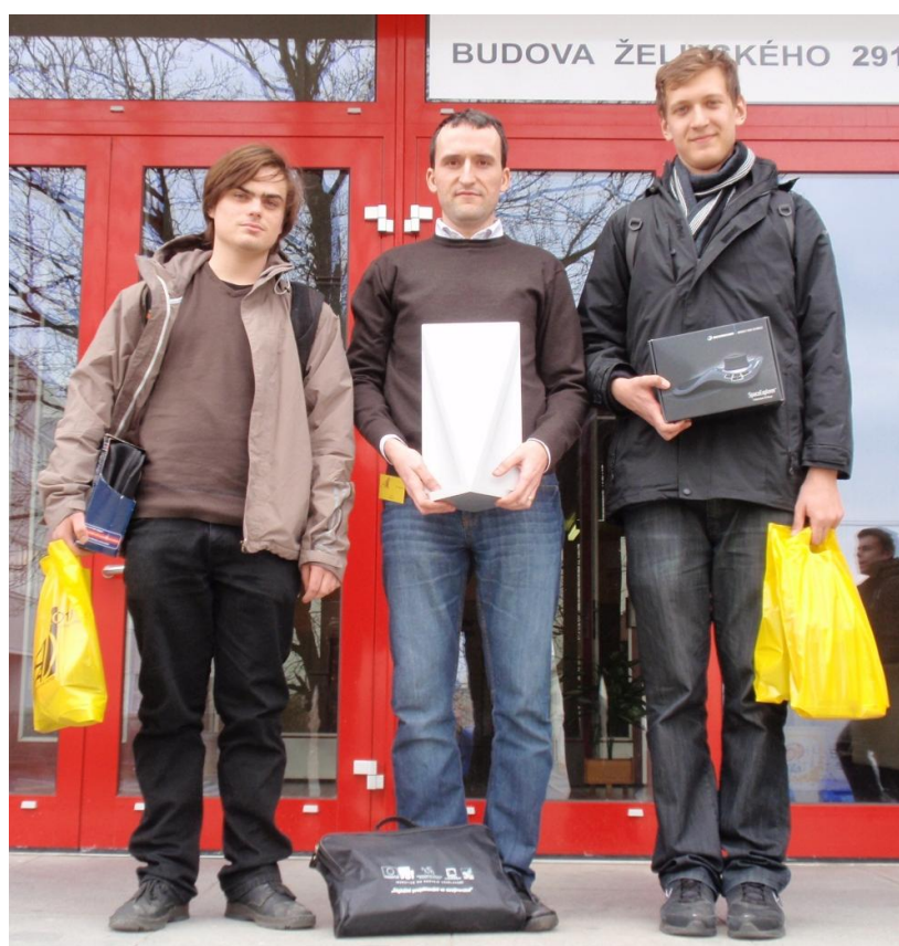
Obrázek 11 - Vítězný tým před budovou školy ve Strakonících