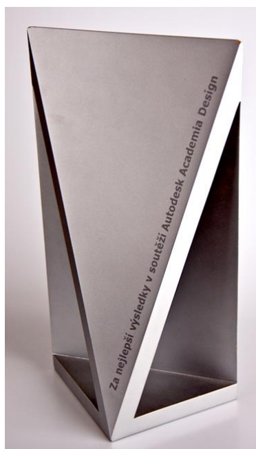
Obrázek 6 - Pohár pro vítěznou školu

Po předvedených výkonech jsme byli všichni tři v očekávání dobrého výsledku. V minulosti skončila naše škola v rámci celkového hodnocení dvakrát na druhém místě a v koutku duše jsme věřili tomu, že letos můžeme svůj úspěch minimálně zopakovat. Vítězství v regionální CADové soutěži nám k tomu dodávalo tolik potřebné sebevědomí.