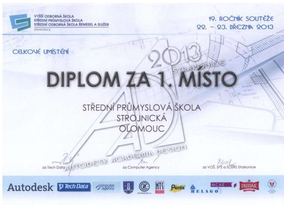
Obrázek 12 - Diplom za celkové umístění v soutěži

Díky všem, kteří se na tomto historickém úspěchu podíleli. Postupem času se nám zúročuje dlouhodobá kvalitní příprava studentů v technických předmětech. Příští jubilejní 20. ročník soutěže se uskuteční na naší škole. Věřím, že organizaci zvládneme stejně dobře jako soutěžení ve Strakonících.