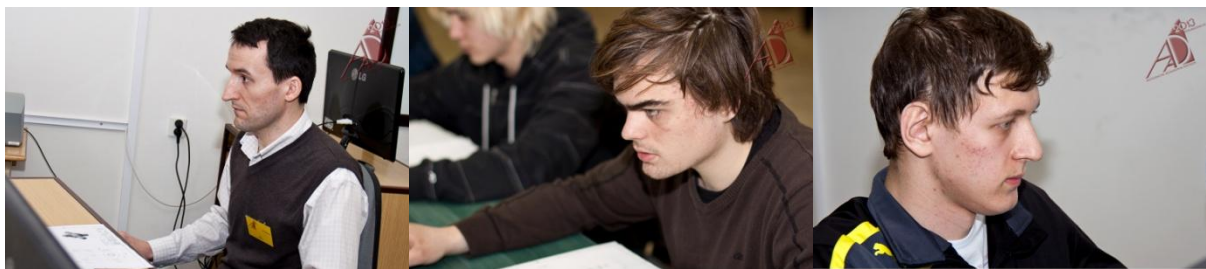
Obrázek 5 - Naši reprezentanti v akci

Po předvedených výkonech jsme byli všichni tři v očekávání dobrého výsledku. V minulosti skončila naše škola v rámci celkového hodnocení dvakrát na druhém místě a v koutku duše jsme věřili tomu, že letos můžeme svůj úspěch minimálně zopakovat. Vítězství v regionální CADové soutěži nám k tomu dodávalo tolik potřebné sebevědomí.