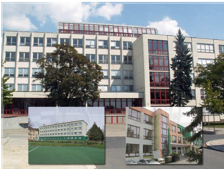
Obrázek 1 - Budovy školy VOŠ, SPŠ a SOŠ Strakonice

Ve dnech 22. – 23. 3. 2013 proběhl 19. ročník mezinárodní soutěže studentů a učitelů středních škol v kreslení a modelování s názvem Autodesk Academia Design 2013. Jedná se o prestižní CAD soutěž, která je z hlavní části podporována firmou Autodesk a MŠMT. Tentokrát se soutěž konala v krásném historickém (zároveň tradičně průmyslovém) městě Strakonice a přímým hostitelem akce byla VOŠ, SPŠ a SOŠ řemesel a služeb Strakonice.