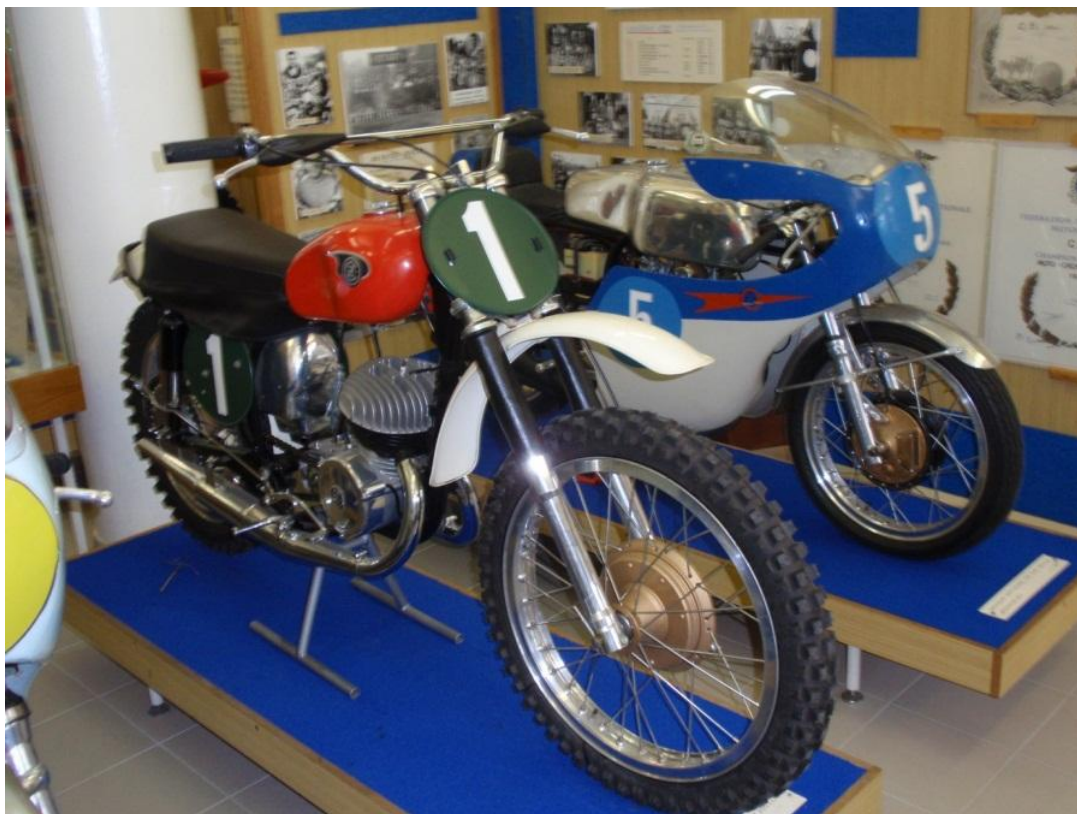
Obrázek 4 – Motocykly z výstavní síně strojírenské firmy ČZ Strakonice, a.s.

Součástí soutěže byla také prohlídka města včetně návštěvy výstavní síně firmy ČZ Strakonice, a.s., která se v současnosti zabývá zejména výrobou pro automobilový průmysl (např. turbodmychadla, formy pro vstřikování plastů).