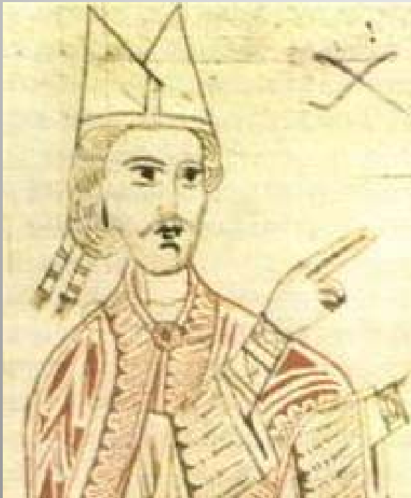
Řehoř VII. (rodné jméno Hildebrand ) nastoupil jako papež roku 1073