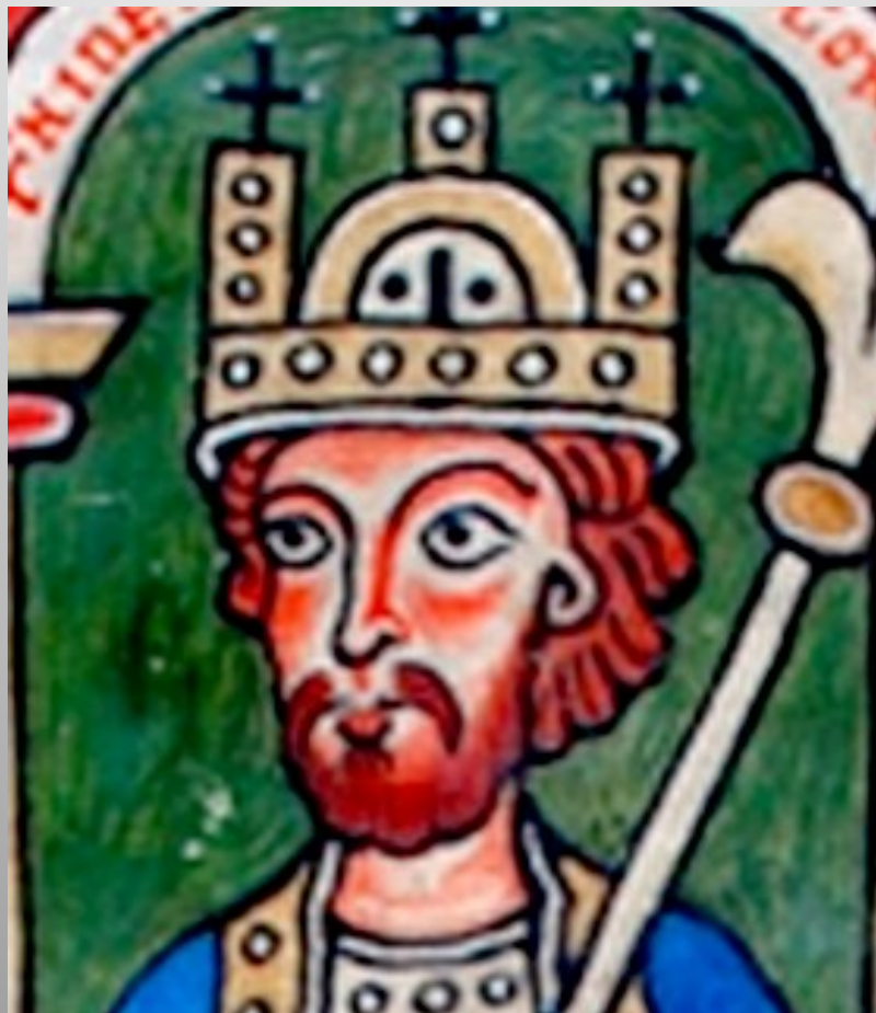
Obrázek č. 9