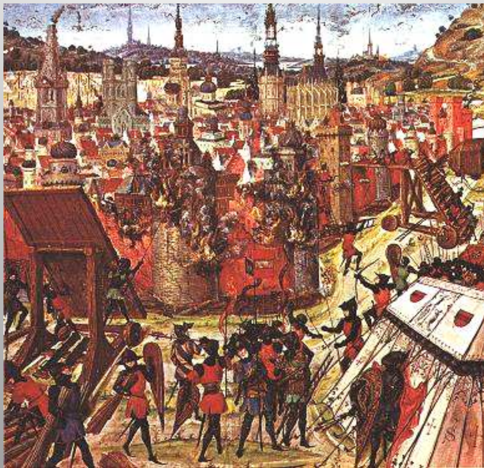
Obrázek č. 8