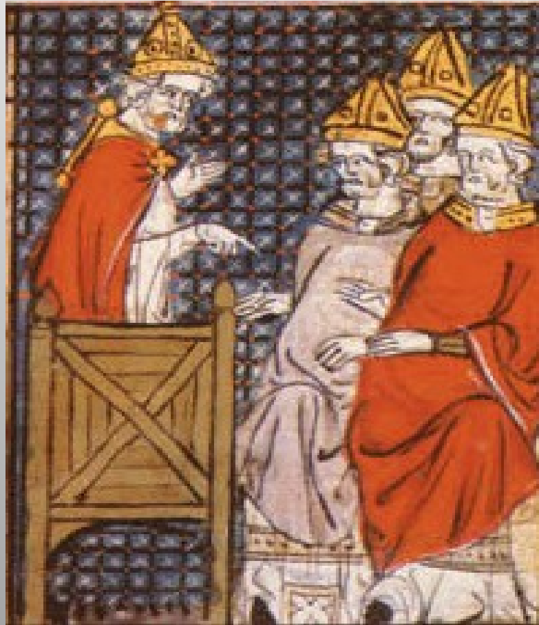
Obrázek č. 6

Papež Urban II. vyzývá k osvobození Svaté země.