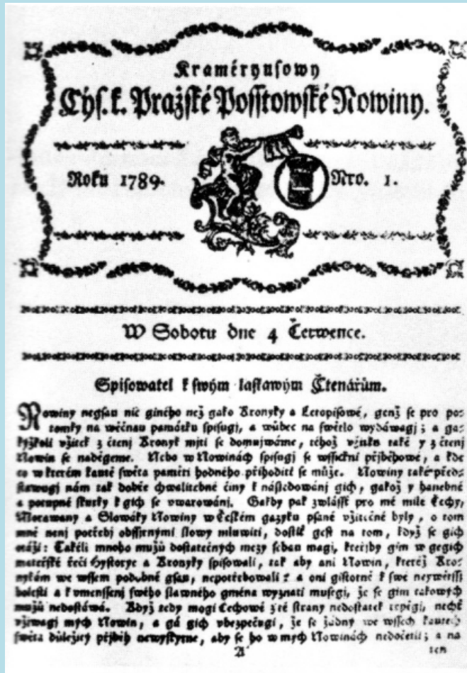
Obrázek č.1 Krameriiovny noviny 1789