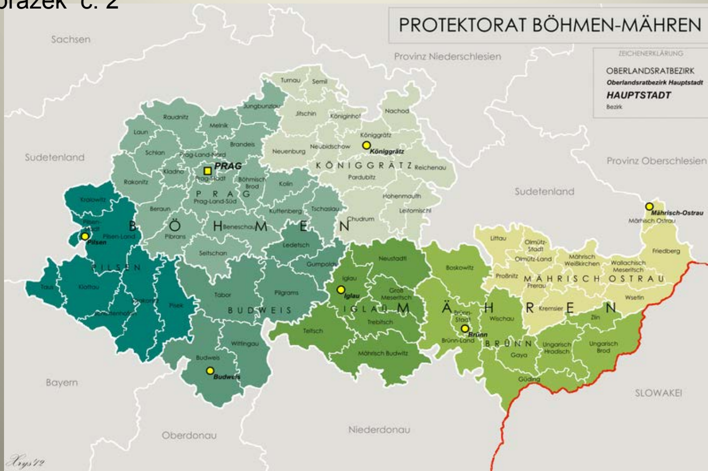
Obrázek č. 2

Řešení: Území Protektorátu se členilo na dvě země – zemi Českou a Moravskoslezskou a dále na okresy – tzv. „Oberlandrats“