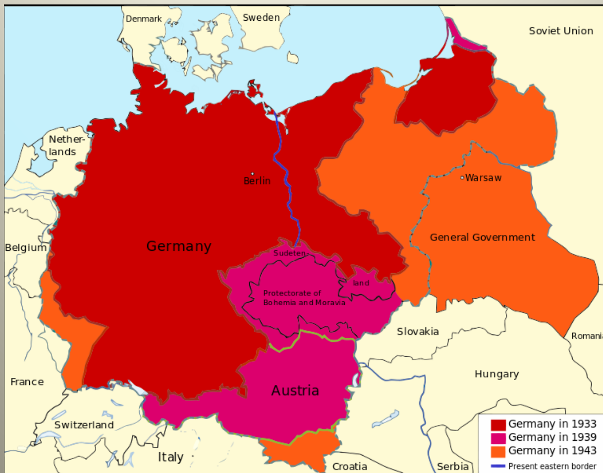
Obrázek č. 1