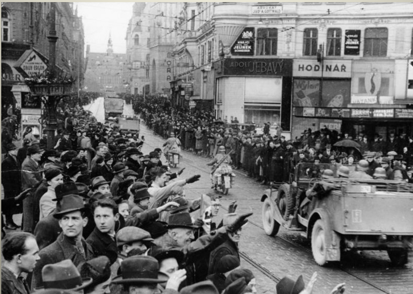
Obrázek č. 3