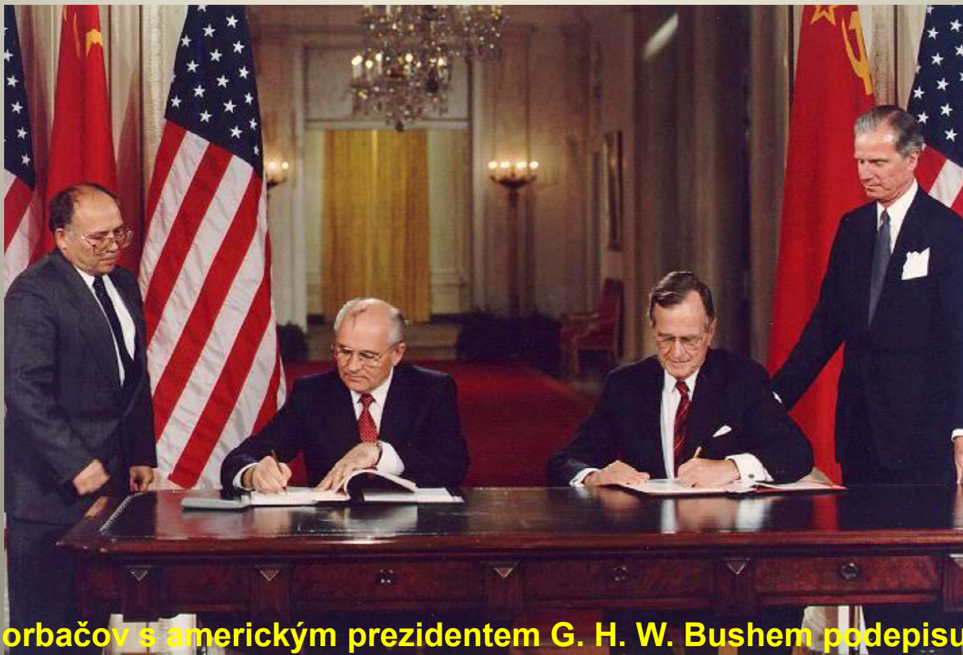
Obrázek č. 9

Gorbačov s americkým prezidentem G. H. W. Bushem podepisují ve Východním pokoji Bílého domu mezinárodní smlouvu o ukončení výroby chemických zbraní a likvidaci jejich zásob 1. června 1990.